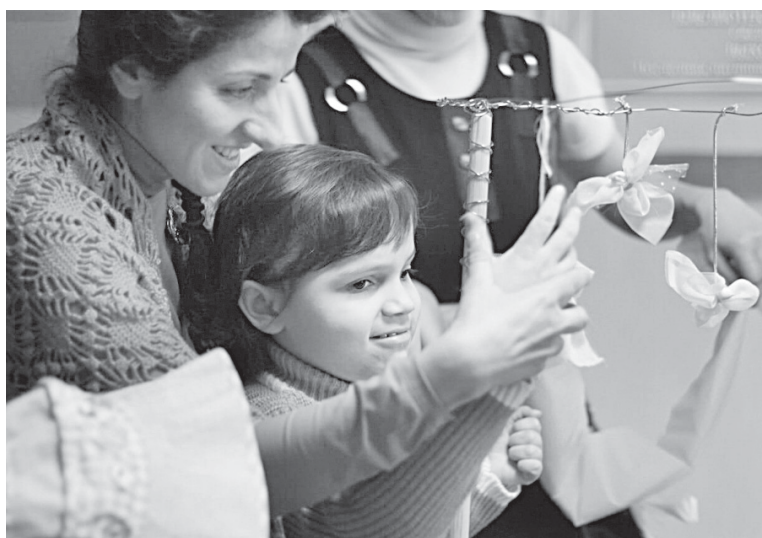
Рождество Христово. 2013 г. Библиотека для слепых и слабовидящих.

дая часть службы сопровождалась разъяснениями священника. В её организации активное участие принимала молодёжь: одни помогали непосредственно духовенству на службе, другие читали определённые богослужебные тексты, а кто-то дежурил около подсвечников.