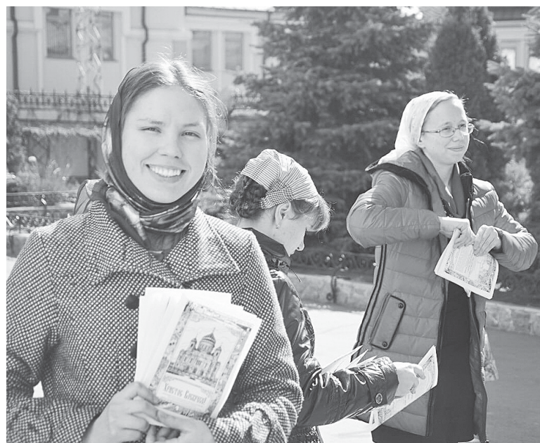
Раздача листовок к Пасхе. Собор, 2014 г.