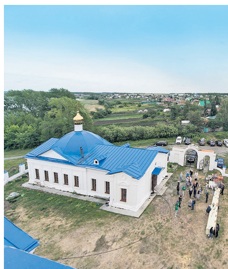
Автопробег по родной стороне. Фоторепортаж