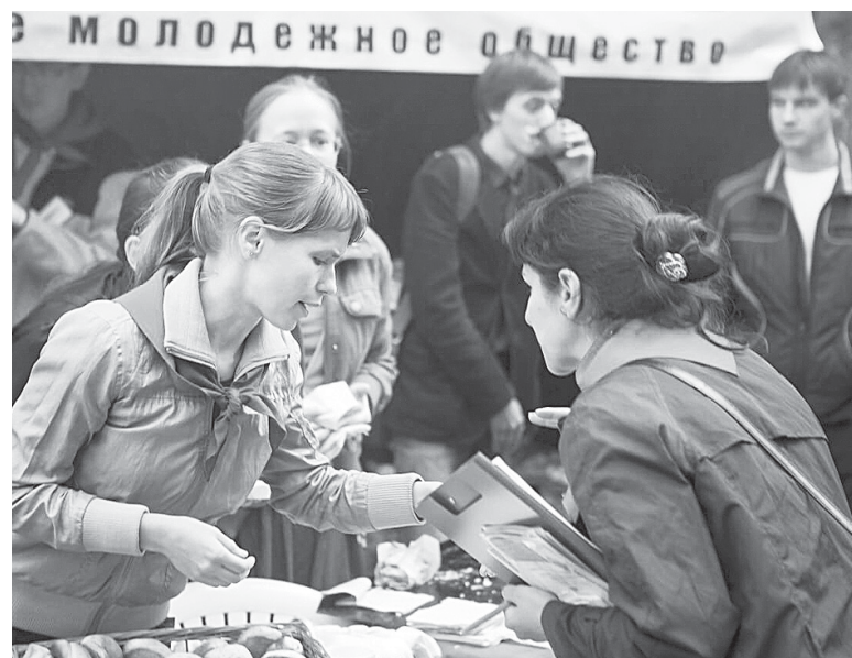
Общественно-политический вернисаж, парк Гагарина, 2013 г.

ся для него, как продукта современного общества, естественной.