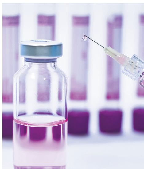
Боятесь ставить прививку от ковида? Совет священника