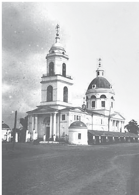
Старинное фото храма.