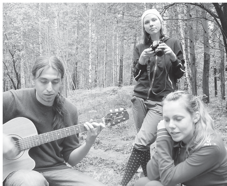
Поход на Шихан, 2011 г.