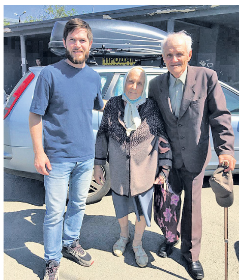
Православное такси и батюшки- хоккеисты